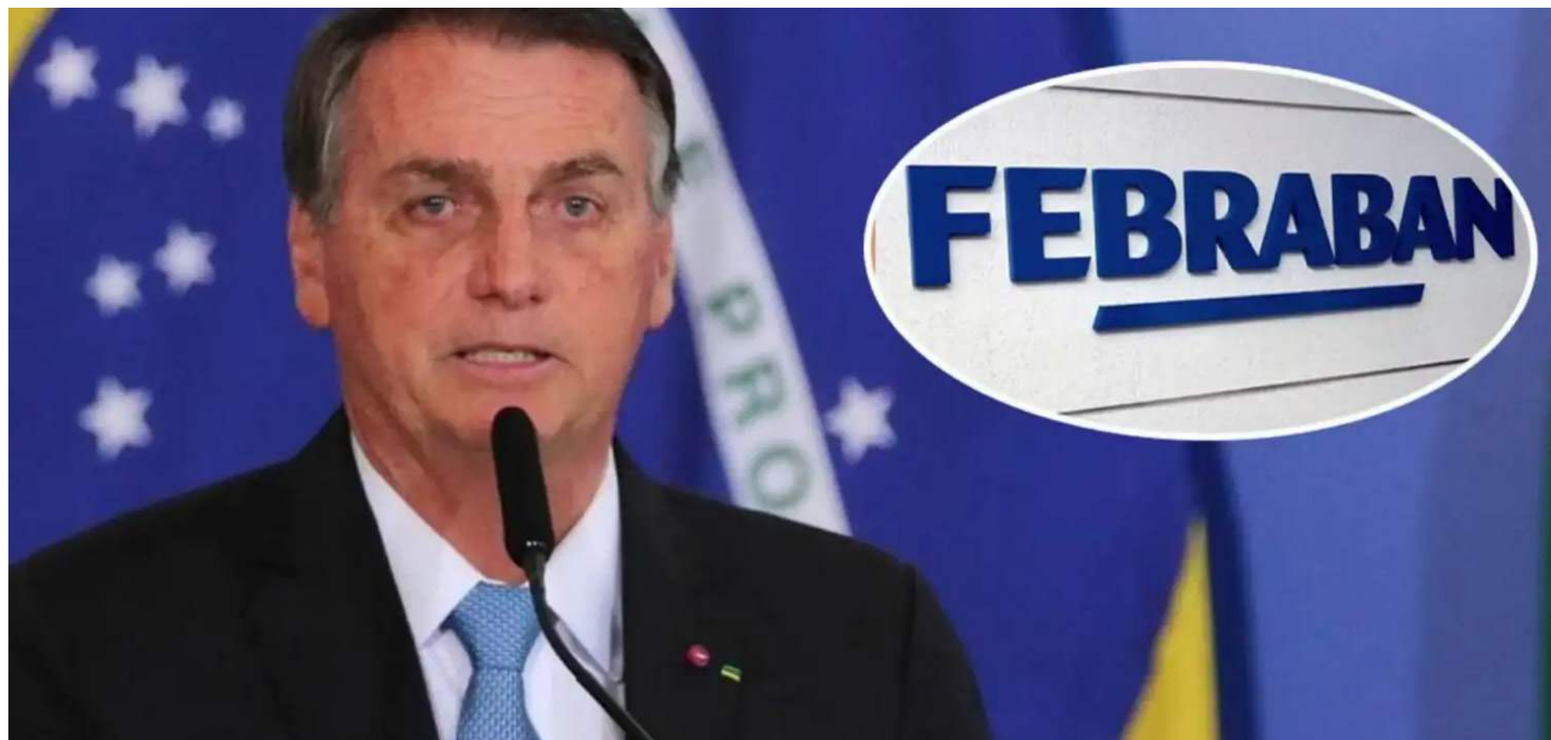
Febraban é tão democrática que vive agarrada com Bolsonaro

A democracia, portanto, seria um governo do PSDB e do MDB. Acredita quem quiser.